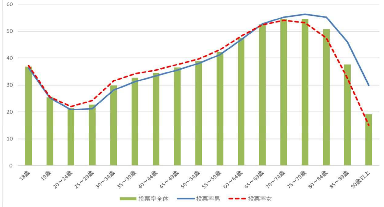
令和5年4月9日執行さいたま市議会議員一般選挙 性別・年齢別投票率